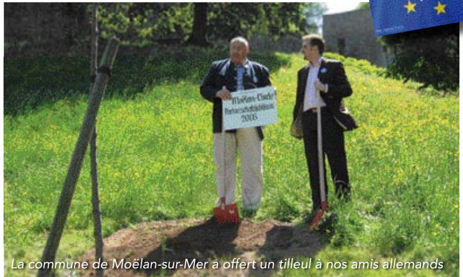
La commune de Moëlan-sur-Mer a offert un tilleul à nos amis allemands

Le tilleul est le symbole de Lindenfels. La ville tire son nom de cet arbre. Par ce cadeau, nous avons voulu marquer l'attachement que nous portons à l'amitié qui nous lie. Elle a des racines profondes, qui tirent leur force des relations franco-allemandes. Nous souhaitons que notre jumelage s'épanouisse pour les années à venir, comme des branches. L'emplacement, choisi par les allemands, nous a beaucoup touché, car c'est au pied du château de Lindenfels que pousse désormais notre tilleul.