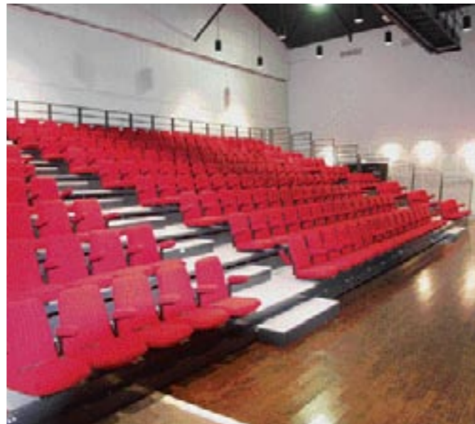
La salle de spectacles peut accueillir 450 spectateurs en places assises, dont 235 sur gradins mobiles.

u Au Rez de jardin : salle de 112 m 2 qui accueille la Cybercommune.