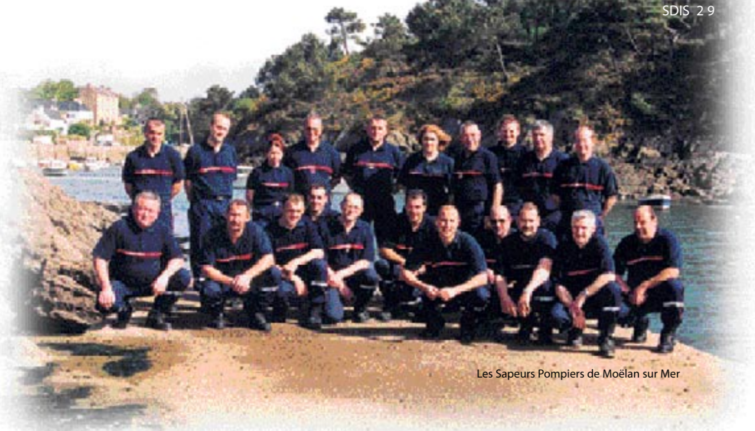
Les Sapeurs Pompiers de Moëlan sur Mer