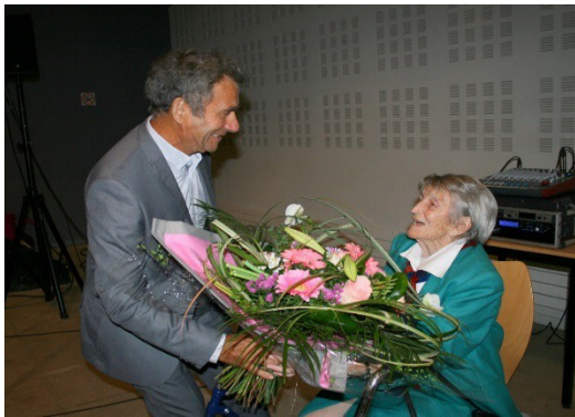
Remise d'un bouquet à la doyenne lors d'un repas des anciens

Ces diverses activités ont réuni plusieurs dizaines de personnes, le succès est croissant.