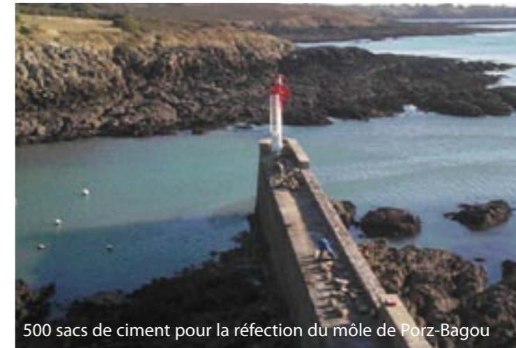
500 sacs de ciment pour la réfection du môle de Porz-Bagou